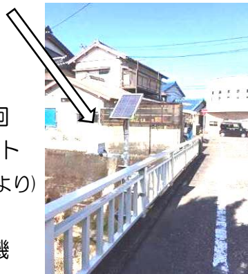
養眞橋に設置された 【危機管理型水位計】

ただ、手が届きやすい高さや位置なので、子どもたちには手を触れたりしないよう注意しました。ソーラーパネルの角が鋭利になっているので危険です（のぞき込まないように）。